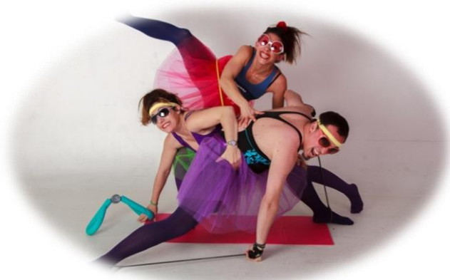
Representación teatral "All Sport"